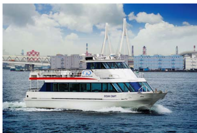
クルーズ船で海から夜景を見ます