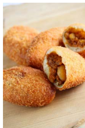
パシフィコ横浜とヨコハマ グランド インターコンチネンタル ホテルで共同開発した美味しい特製カレーパン「ぷかりパン」付 (通常は、数量限定販売。ホテル店舗で購入可)