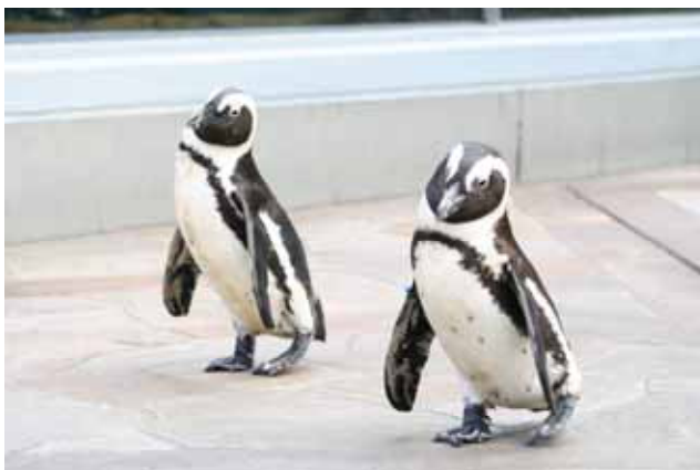
ペンギン(横浜・八景島シーパラダイス)