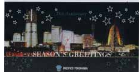
開業15周年記念 特製オリジナルポストカード

パシフィコ横浜からは、現在限定発売中の「開業15周年記念 特製オリジナルポストカード」をプレゼント。横浜の美しい夜景をベースに、キラキラとしたラメが光るデザインとなっています。