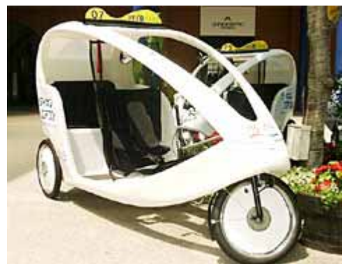
京都のペロタクシー http://www.lookpage.co.jp/topics/no020819/