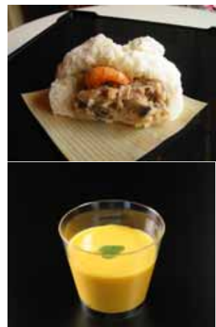
招福門 ふかひれまん・マンゴープリン

麒麟ビール(フォアローゼズを使ったホットカクテル 他)、横浜の水「はまっ子どうし」 ヨコハマ グランド インターコンチネンタル ホテル(チョコレートファウンテン) など