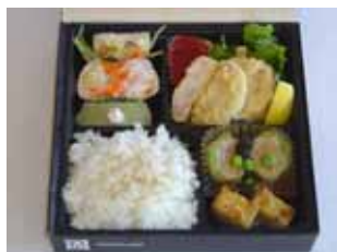
横濱シネマストリート