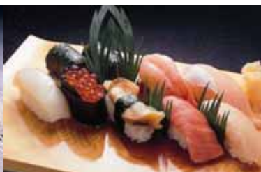
にぎり寿司(イメージ)