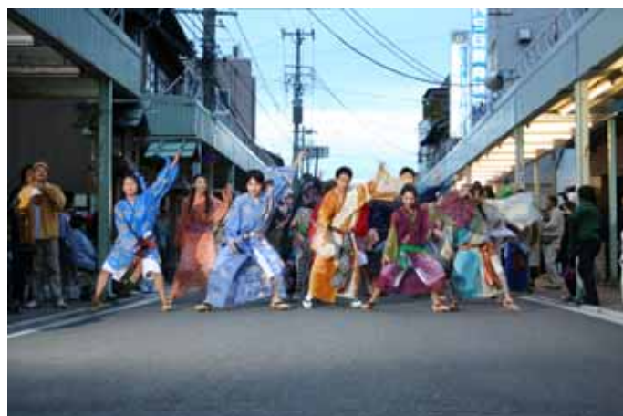
下駄総踊り(イメージ)

新潟・横浜の祭りを代表して、 新潟の「下駄総踊り」「万代太鼓」や 横浜の「ハマこい」「大道芸」などの パフォーマンスや 「Sea express」のコンサート が行われます。