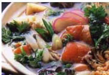
食の陣オリジナル鍋「越の錦鍋」