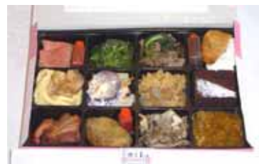
横浜開港西洋弁当