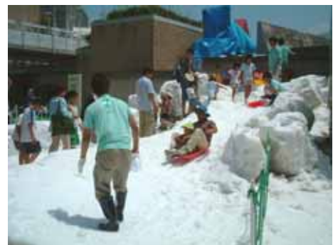
雪あそびひろば(イメージ)