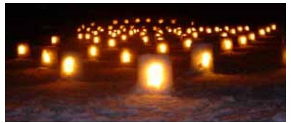
雪あかりひろば(イメージ)