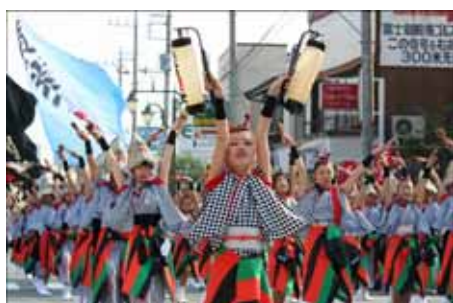
ハマこい(イメージ)