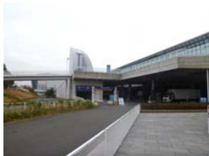
①展示ホール北より入庫

※サイドカー付や改造などによる特殊大型車両については、普通自動車の扱いとなります。