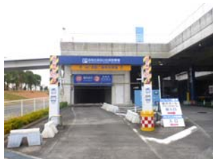
②ゲートバーの隙間より入庫してください