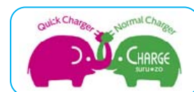
チャージスルゾウロゴ