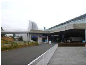
①展示ホール北より入庫

※サイドカー付や改造などによる特殊大型車両については、普通自動車の扱いとなります。