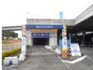
②ゲートバーの隙間より入庫してください