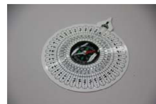
メッカの方向を確認するための礼拝用コンパス